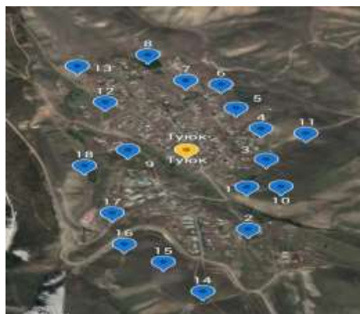
Рисунок 1-ход проведения измерений по Алматинской области на карте

Диапазон измерения скорости экспозиционной дозы составляет от 5 до 2. * 10 4 мкЗв / ч-1. допустимый основной предел относительной погрешности составляет ±30%. Пешеходная гамма-съемка территории производилась с использованием детальной сети в зонах радиоактивного загрязнения.